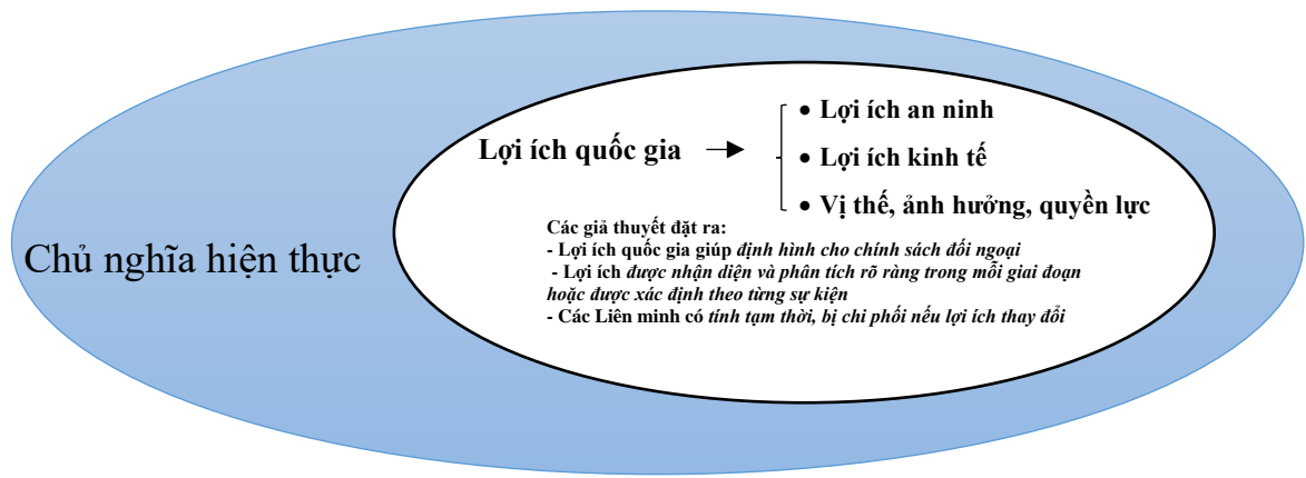
Hình 1.1. Khung lý thuyết

Dựa trên khung lý thuyết bên trên, luận án đề xuất mô hình nghiên cứu dưới đây (hình 1.2).