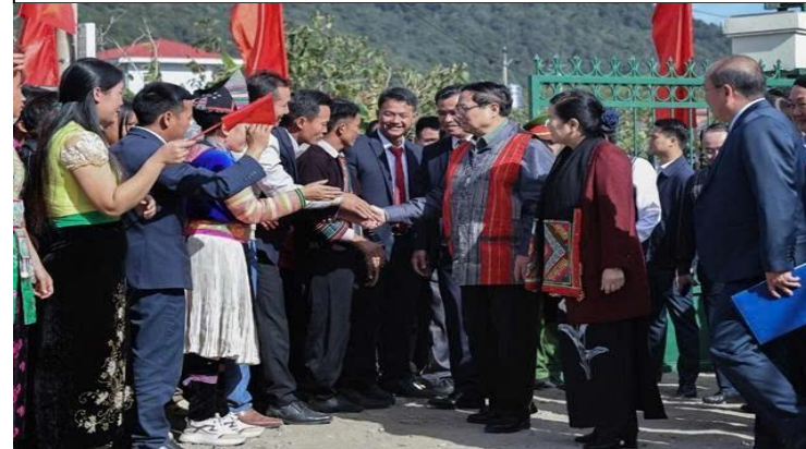
Thủ tướng Chính phủ Phạm Minh Chính dự ngày hội Đại đoàn kết cùng Nhân dân các dân tộc tỉnh Lai Châu