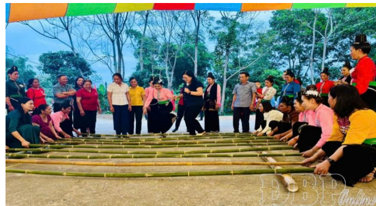
Ngày hội Đại đoàn kết dân tộc tại tỉnh Điện Biên