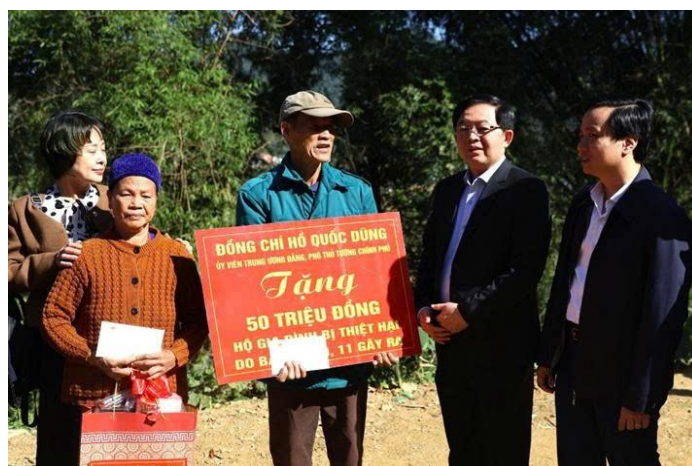
Phó Thủ tướng Hồ Quốc Dũng thăm và tặng quà nhân dân tỉnh cao Bằng