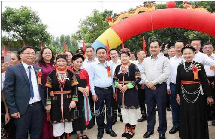
Thường trực Ban Bí thư dự Ngày Hội đại đoàn kết dân tộc tại tỉnh Lào Cai