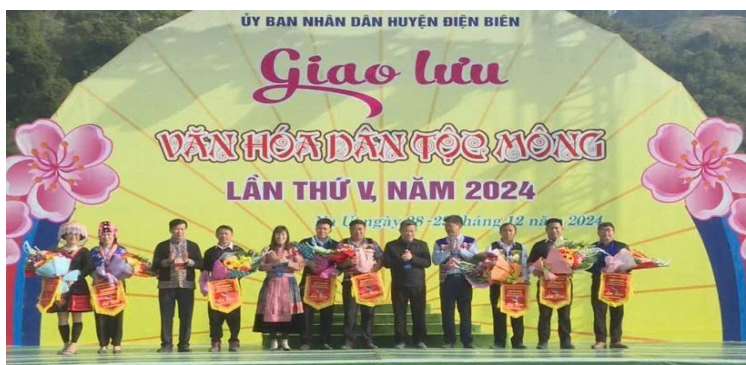
Giao lưu văn hóa dân tộc Mông tại tỉnh Điện Biên