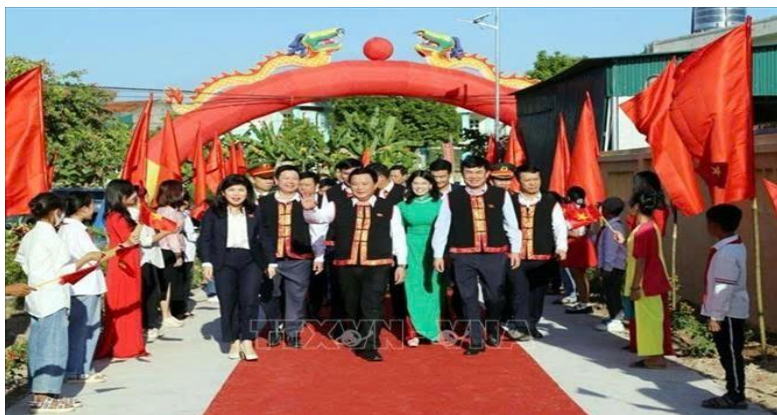
Đồng chí Nguyễn Xuân Thắng dự Ngày hội Đại đoàn kết dân tộc tại tỉnh Quảng Ninh