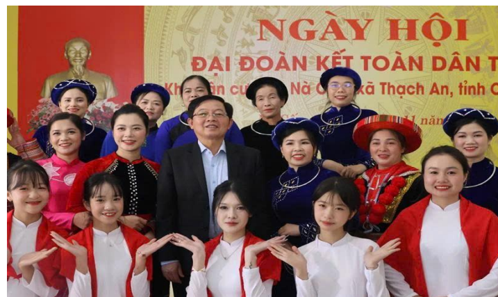
Phó Thủ tướng Hồ Quốc Dũng chung vui với bà con nhân dân khu dự cư Nà Cốc, Cao Bằng trong Ngày hội Đại đoàn kết toàn dân tộc