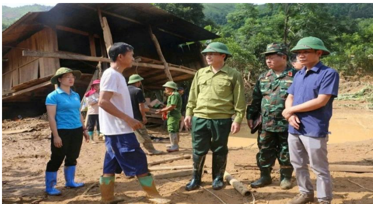
MMTTQ tỉnh Điện Biên đồng hành cùng dân trong khắc phục thiên tai