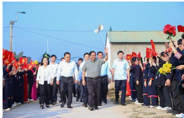
Thủ tướng Phạm Minh Chính chung vui ngày Hội đại đoàn kết toàn dân tộc tại tỉnh Lạng Sơn