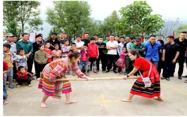
Đồng bào các dân tộc tỉnh Hà Giang chơi trò chơi dân gian trong Ngày hội đại đoàn kết toàn dân tộc