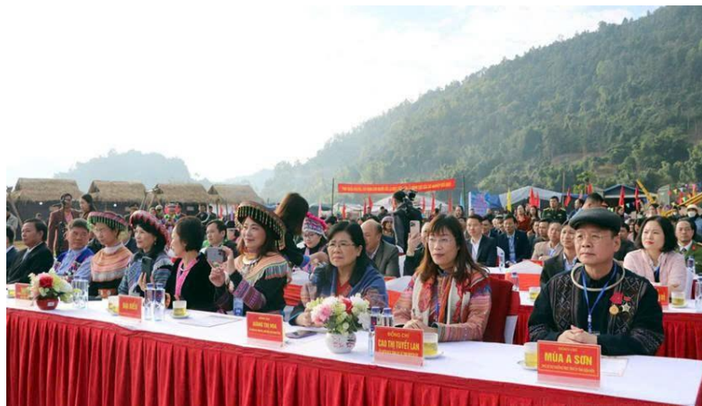
Lễ hội văn hóa dân tộc Mông tại tỉnh Điện Biên