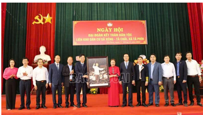
Các đồng chí lãnh đạo tỉnh Lào Cai dự Ngày hội đại đoàn kết dân tộc