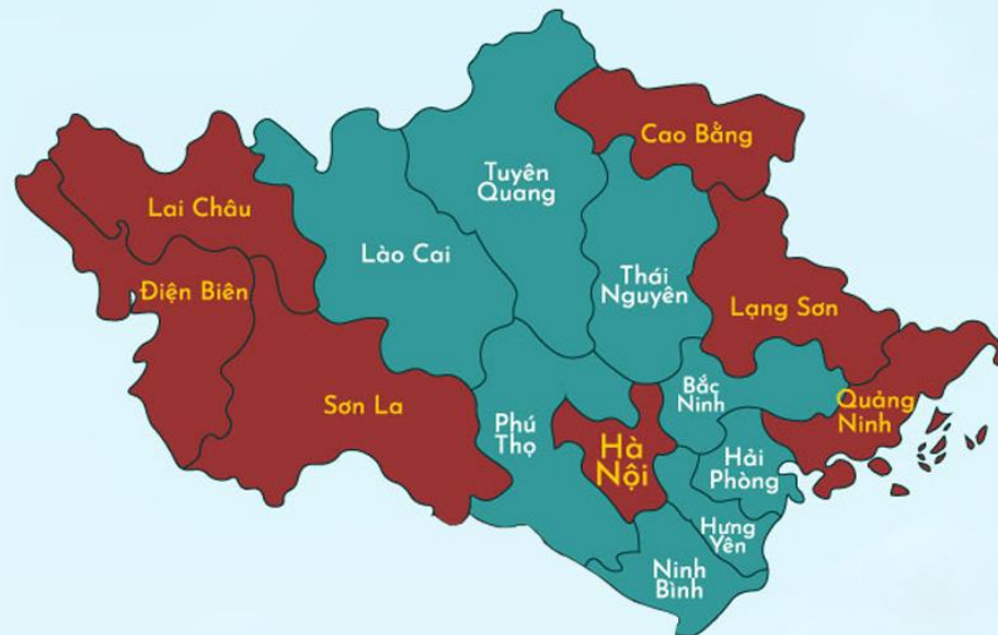
Phụ lục 2: Bản đồ hành chính 07 tỉnh miền núi Phía bắc, Việt Nam giáp danh với Trung Quốc