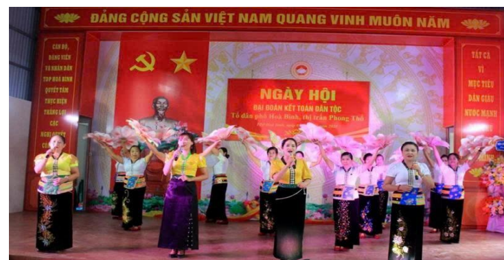
Ngày hội Đại đoàn kết dân tộc tại tỉnh Lai Châu