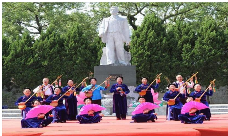
Đồng bào dân tộc Nùng, Lạng Sơn vui tết Độc lập