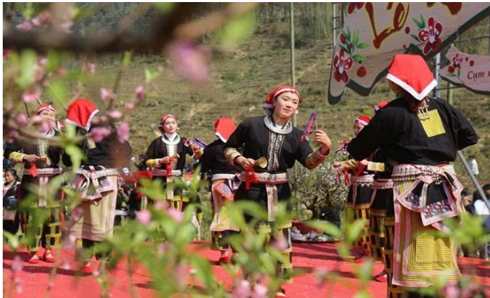
Lễ hội đồng bào dân tộc Dao đỏ tại Sa Pa, Lào Cai