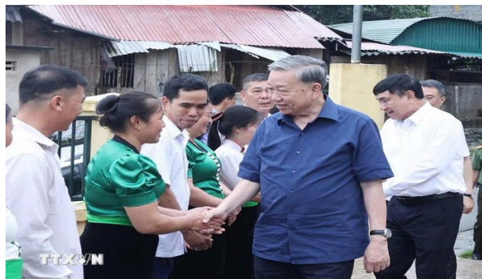
Tổng bí thư Tô Lâm đến thăm và tặng quà cho cộng đồng bản Tân Lập, Xã Si Pa Phìn, Tỉnh Điện Biên