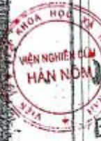
Trang 2: Lời tựa